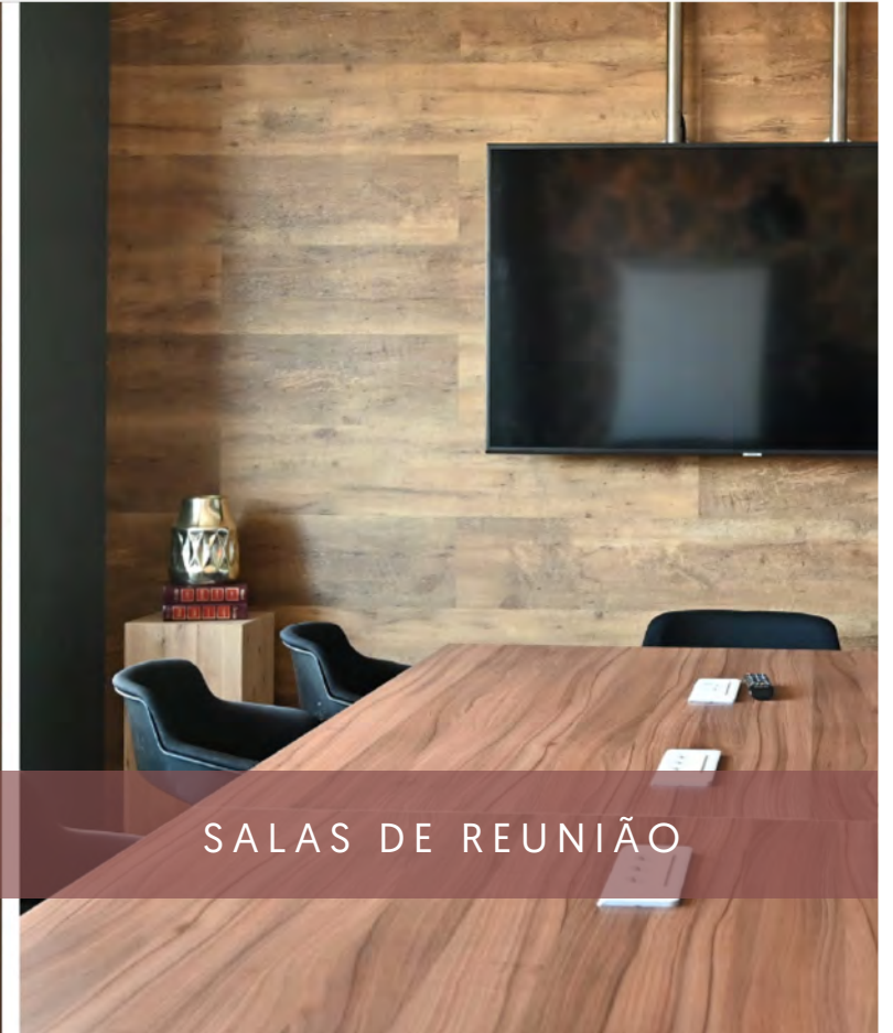
SALAS DE REUNIÃO